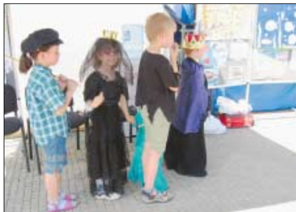
Hvězdy představení Proč nechtl Honza princeznu za ženu bezprostředně před vstupem na jeviště (ZŠ Sázavská)