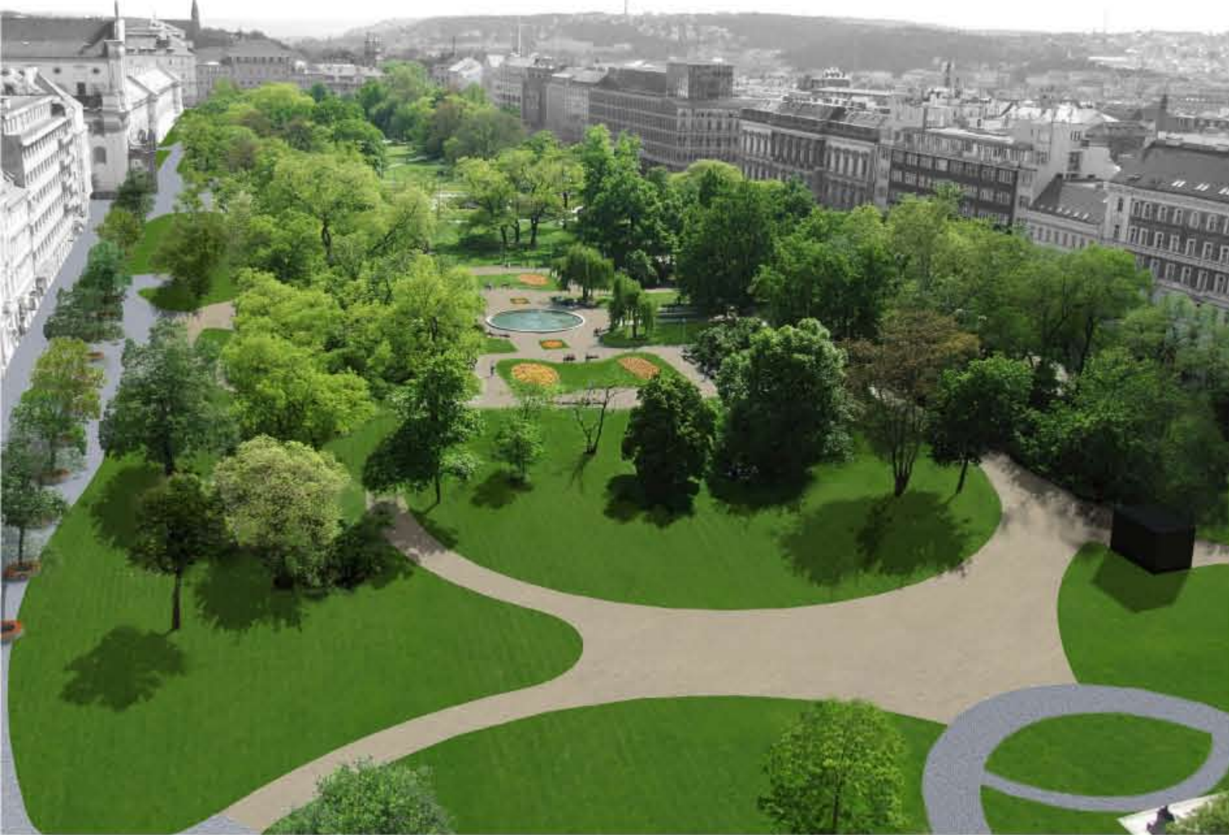
VIZUALIZACE - POHLED Z VĚŽE NOVOMĚSTSKÉ RADNICE