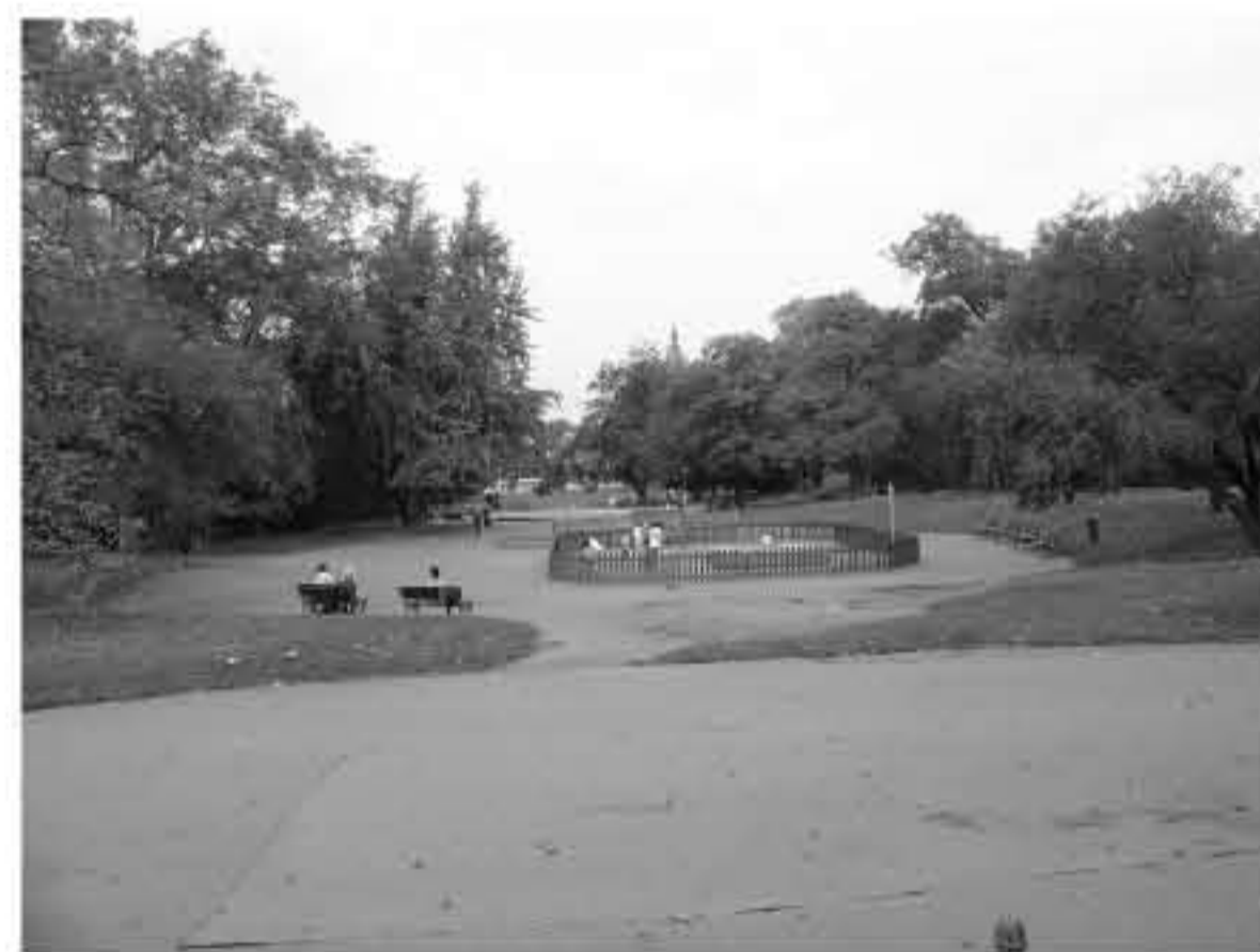
SKUTEČNÝ STAV - VÝCHOZÍ FOTOGRAFIE PRO VIZUALIZACE