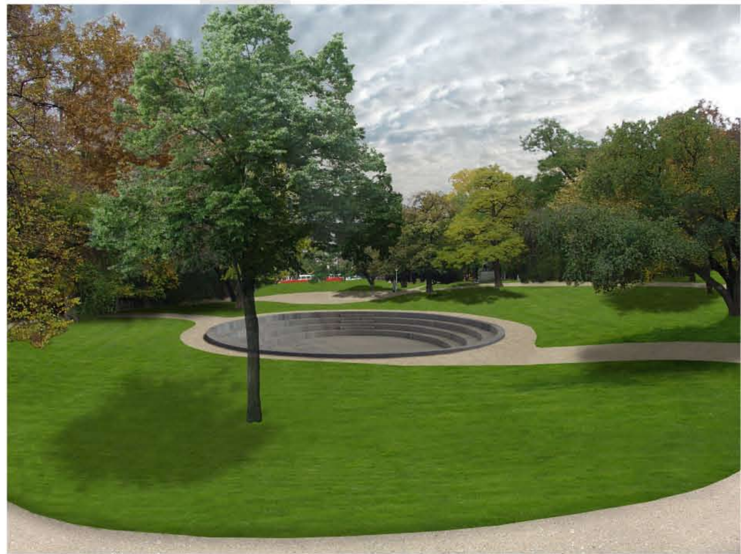
VIZUALIZACE - POHLED OD POMNÍKU ROETZLERA SMĚREM NA SEVER