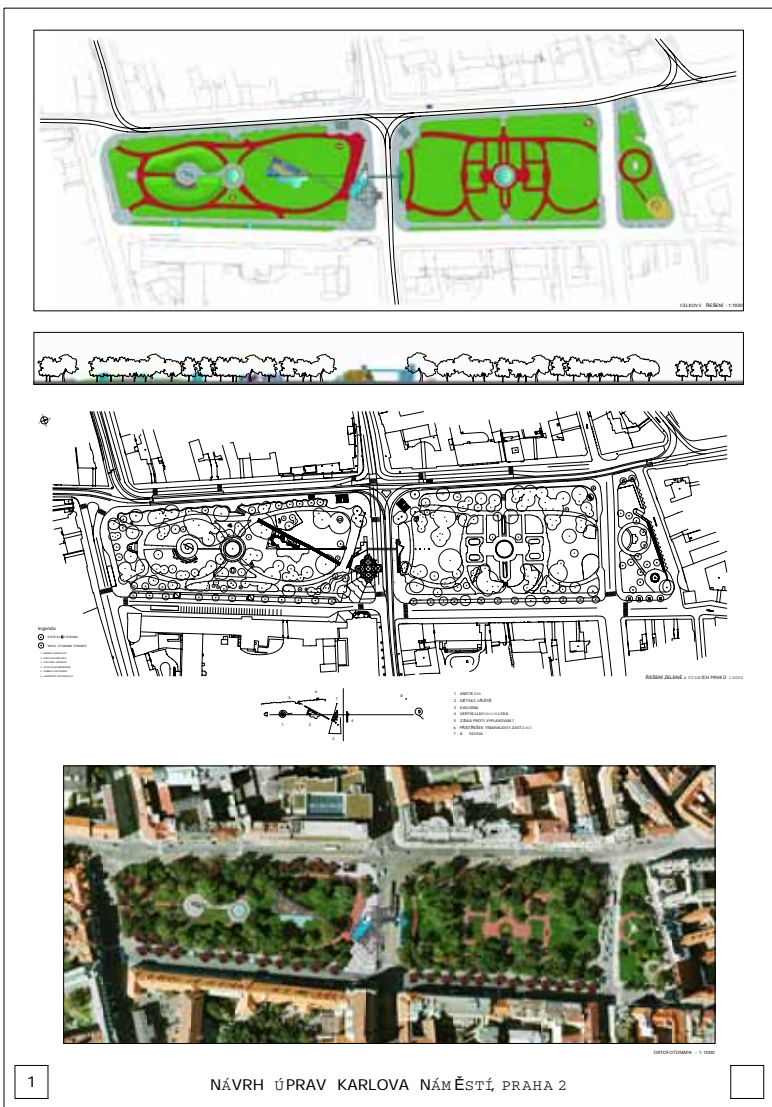
1 NÁVRH ÚPRAV KARLOVA NÁMĚSTÍ, PRAHA 2

Třetí etapa by se měla týkat zbývajících úprav ve střední a severní části parku.