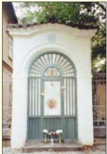
Ve které ulici městské části Praha 2 stojí kaplička na snímku?

Kulturní sdružení Nová Akropolis, sídlící v Sokolské 29, připravilo na červenec zajímavé akce, které jsou podporovány grantem městské části Praha 2. V sobotu 22. července je pro zájemce připravena od 14:00 do 17:00 výtvarná dílna Umění starověku ; přihlášky předem na tel.: 222 515 152, na e-mailu: nova@akropolis.cz nebo přímo v Sokolské 29 (ve všední dny 18:00 – 21:00). Přednáška s videoprojekcí Antický Řím se bude konat v úterý 22. července od 19:00, studenti a senioři sňížně vstupné. Další informace na www.akropolis.cz .