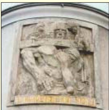
Domovní znamení, o kterém jsme psali v minulém čísle, najdete na nároží Karlova nám. a Ječné