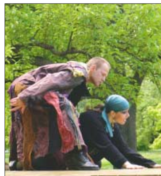
Fotografie z loňského ročníku VyšeHrátek: inscenace Sen noci svatojánské v provedení studentů Katedry alternativního a loutkového divadla pražské DAMU